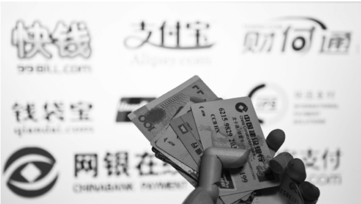
分析人士认为,以外汇结算的跨境支付业务利润率可能达到 2%—3%,因而将会有越来越多的第三方支付企业布局跨境支付。

专业跨境电商平台西游列国首席执行官杨义华认为,可以利用自贸区在海关监管上“一线彻底放开”的优势,开设一个跨境电子商务网站,让消费者同步购买全球的打折商品。这个平台能够提供关税代缴服务,从而避免在当前的代购模式