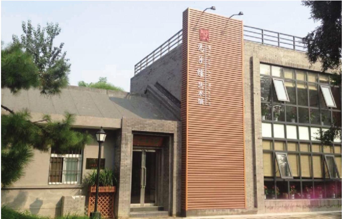
位于北京双秀公园内的马子恺艺术馆