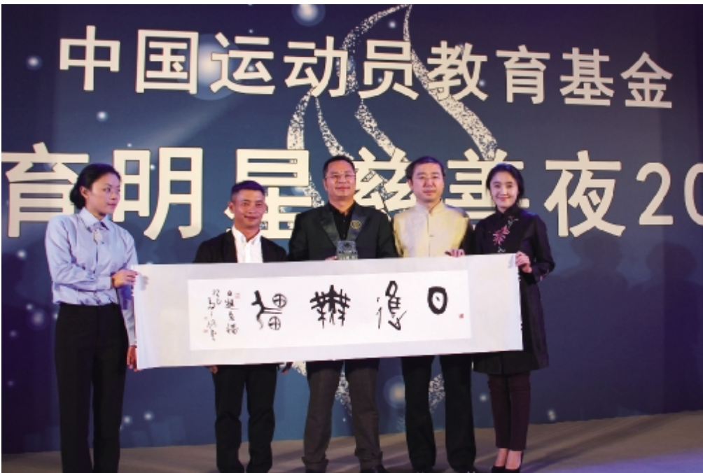
成功拍出“一字十万元”