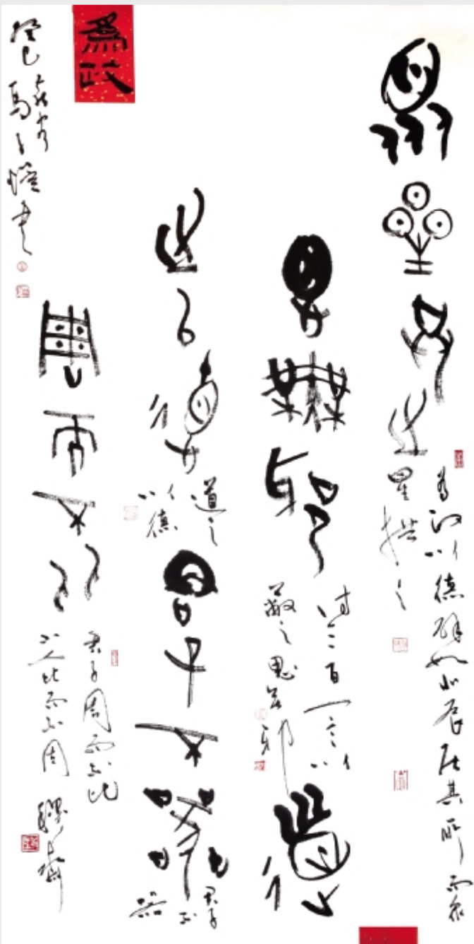
《论语一为证》136 x 68cm