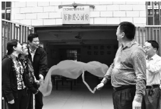
“爱心厨房”落成典礼