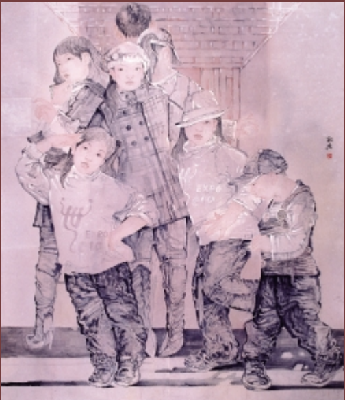
我们一起游世博 220cm × 200cm