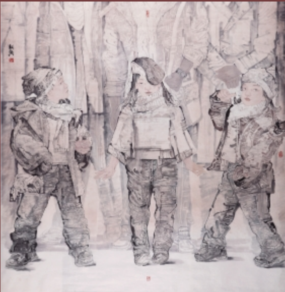
希望系列之绽放明天 210cm × 210cm