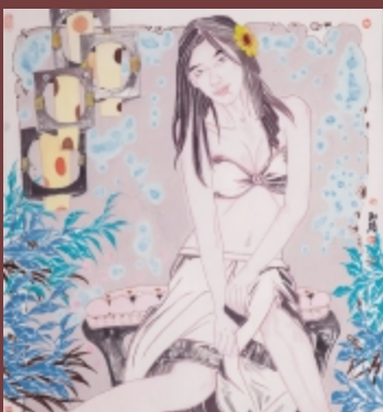
弄妆梳洗迟之一 98cm × 90cm