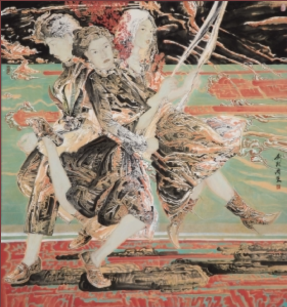
青春旋律 180cm × 180cm