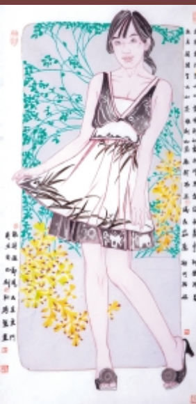
出其东门 138cm × 69cm