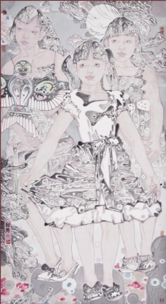
花季之轻舞飞扬 180cm × 90cm