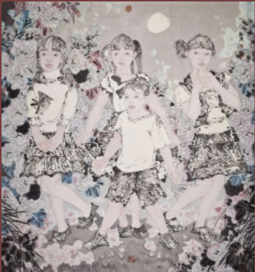
我们的祖国是花园 210cm × 210cm 入选辉煌浦东 2011 中国画作品展览