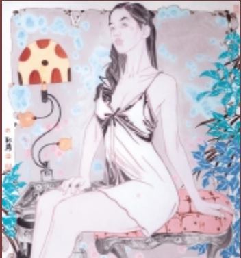
弄妆梳洗迟之二 98cm × 90cm