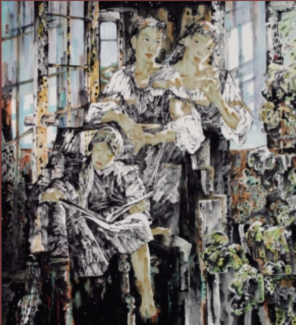
一米阳光 180cm × 170cm