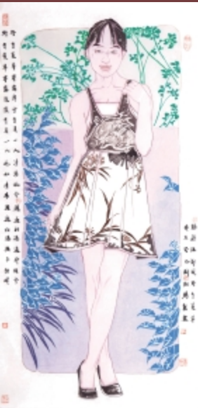
野有蔓草 138cm × 69cm