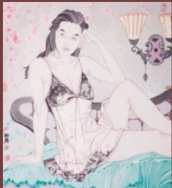
懒起画蛾眉之一 98cm × 90cm