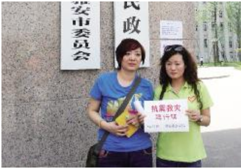
领到抗震救灾通行证

“是什么力量让我们凝聚在那条泥石俱下的山路? 兄弟,是什么情结让大家相拥而泪水横流却又无声? 我们跋涉千里,我们风驰电掣! 为了雅安,为了天全,也为了世间的面孔不再陌生! 兄弟,那就让青春的激情继续,让时光的记忆永恒! 铭记吧,刻在4.20心房上的那一刀痕。”——易之创作的这首《致参战雅安救援的兄弟》的诗正激励着越来越多的热血青年加入到灾后援建的行列。