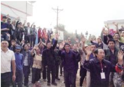
老场乡村民挥手告别救援队