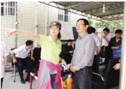
公益组织向当地政府负责人了解情况