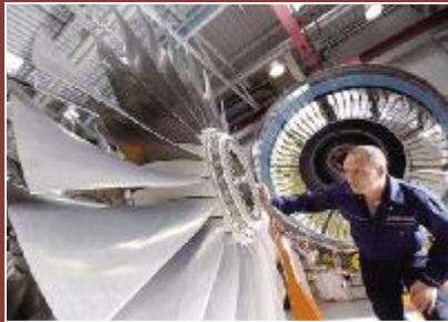
中航发动机控股有限公司

上海荣坤贸易有限公司立足于华东地区的国际化优势,以建设具有国际竞争力的大型企业集团为发展目标,突出有色金属贸易的专业化发展,与上游产业建立紧密合作关系形成直接代理优势,与期货公司结盟创新贸易模式,赢得了国内外上下游伙伴的高度认同和金融机构的充分认可,成为享誉华东地区的电解铜、铝锭等有色金属贸易商,持续实现高速发展。2012年销售额一举突破300亿元,增长率达到180%。