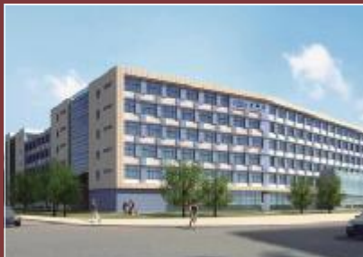
苏州新海宜通信科技股份有限公司

这家老百姓耳熟能详却又低调得不能再低调的公司,服务网络已经从当初的中山,到布局华南、华东、华中、华北;从中国大陆延展到香港、台湾,直至韩国、美国等海外。仅在中国大陆就有近4000个营业网点,员工15万人。如今已经突破了百亿元的年销售额,成为可以与中国邮政EMS抗衡的民营快递巨头。