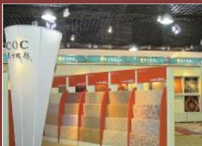
东方地毯集团有限公司

公司隶属于中国航空工业集团公司,公司着力打造品牌价值、商业模式、集成网络创新“三位一体”的企业核心竞争力,以研制更为先进、更为可靠的产品为己任,努力成为世界一流的动力产品及服务供应商。年营业收入从2009年的259.8亿元提升至2012年的453.72亿元,年均增长率为21%;利润从2009年的11.78亿元提升至2012年的16.1亿元,年均增长率为11.5%;EVA从2009年的4.39亿元提升至2012年的6.66亿元,年均增长率为15.1%。