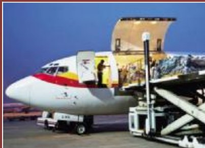
顺丰速运(集团)有限公司

陕西彬县煤炭有限公司自1998年由国有企业改制为股份合作制企业以来,连年保持跨越式增长,从一个濒临关闭的地方小煤矿发展成为集煤炭、电力、煤化工、房地产、建材、物流、金融投资为一体的大型企业集团。与改制前相比,总资产增长139倍,原煤产量增长11倍,销售额增长213倍,实现利润和上缴税费分别增长300倍以上。2011年销售利润率、资产增长率、人均创利分别居于全国煤炭行业第一、第二、第四位,2012年的相关指标预计继续走在全国行业前列。企业跻身中国煤炭工业百强和中国民营企业500强。