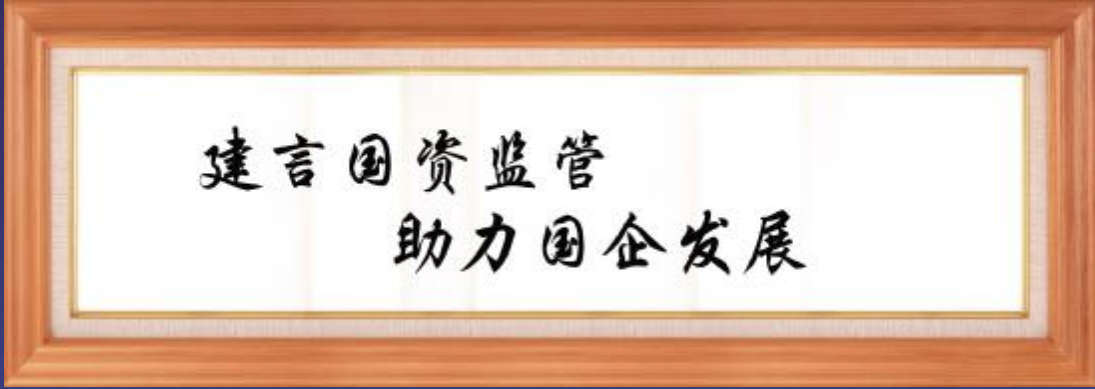
国务院国资委主任、党委书记王勇祝贺《中国国资报道》创刊题词

顺应时代大势,汇集天地人和。集报纸、网站、手机报、视频、舆情要报于一体的《中国国资报道》全媒体“五胞胎”诞生了! 《中国国资报道》全媒体的孕育与诞生,得到了中央领导和社会各界的支持。长期领导和关心中国国资国企改革与发展的第十届全国政协常务副主席,中国企业联合会、中国企业家协会会长王忠禹专门题写了贺词,指明方向,寄予厚望,祝愿《中国国资报道》“围绕中心,服务大局,办出特色”。国务院国资委主任、党委书记王勇明确指示,国资国企宣传“要利用好《中国企业报》这一平台”。《中国国资报道》得到了国务院国资委宣传局、研究局、各省市国资委以及众多国资国企领导的鼓励与支持。 渠道决定传播力。随着互联网与数字技术迅猛发展,在传统纸媒的基础上,我们坚持以市场化为导向,应用高技术,秉承着一专三全的理念,以全球化的视野,实现多媒体、全产业链发展,以数字化引领,全媒介经营为指导思想,实现网站、视频、移动终端等多种新兴媒体共同发展的新局面,打造为国资国企服务的专业媒体。《中国国资报道》专门刊发关于国资国企的重要评论、理论文章,深入报道国资工作进展、重大活动和各类国有企业发展成就;中国国资报道网、《中国国资报道》手机报、《中国国资报道》视频中心三种不同形式的新媒体,形成网报互动、立体传播,发挥不同媒体形式的互补作用;中国国资报道舆情要报重点提供全天候、全网络、全球化的新型智力支撑和深度决策支持。 “专业,高端,引领”是我们的新闻理念,通过全媒体平台,积极围绕中心,突出重点,服务企业,踏踏实实做工作,发挥国资国企宣传主渠道和正确舆论导向引领作用。《中国国资报道》全媒体肩负的是时代赋予的使命,与中国国资国企改革同行。