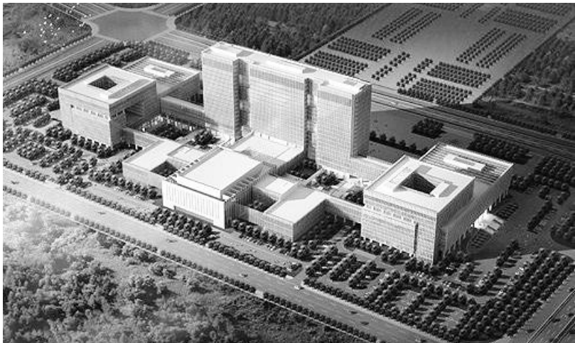
临桂新区创业大厦

临桂新区是桂林世界旅游城建设的主战扬、是桂林跨越发展的机遇。如上海的浦东,“临桂理想”的实现,就是桂林未来跨越发展最闪光的亮点。