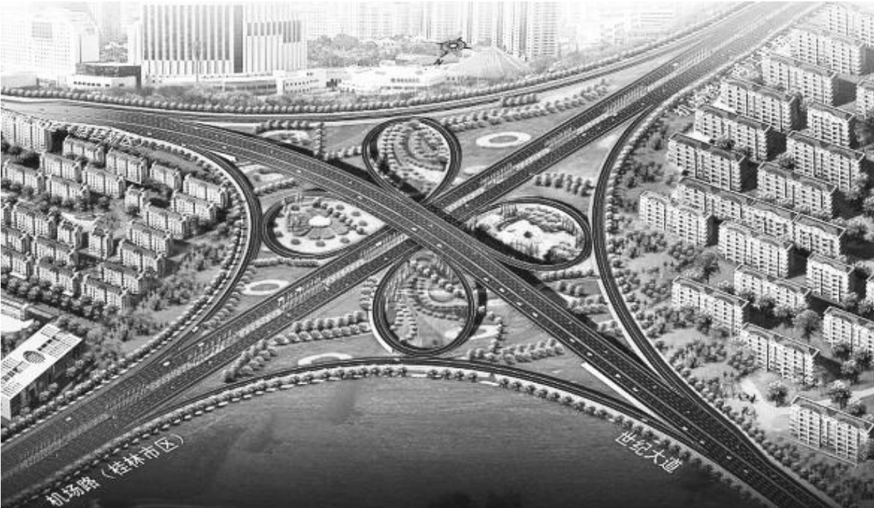
临桂新区世纪大道立交桥主体工程

江边裹足不前。“保护漓江、发展临桂,再造一个新桂林!”经过多年苦苦思考和探索,也许是受当时西部大开发和上海开发浦东的启发,时任广西书记的刘奇葆带领广西区党委和桂林市人民政府大胆破题,决心让桂林搭上快速发展的时代列车继续前进。从此,桂林走进了“临桂新区时代”。