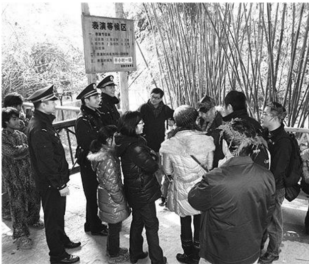
阳朔县城关派出所警察在美丽的景区巡逻,为企业和游客保驾护航。