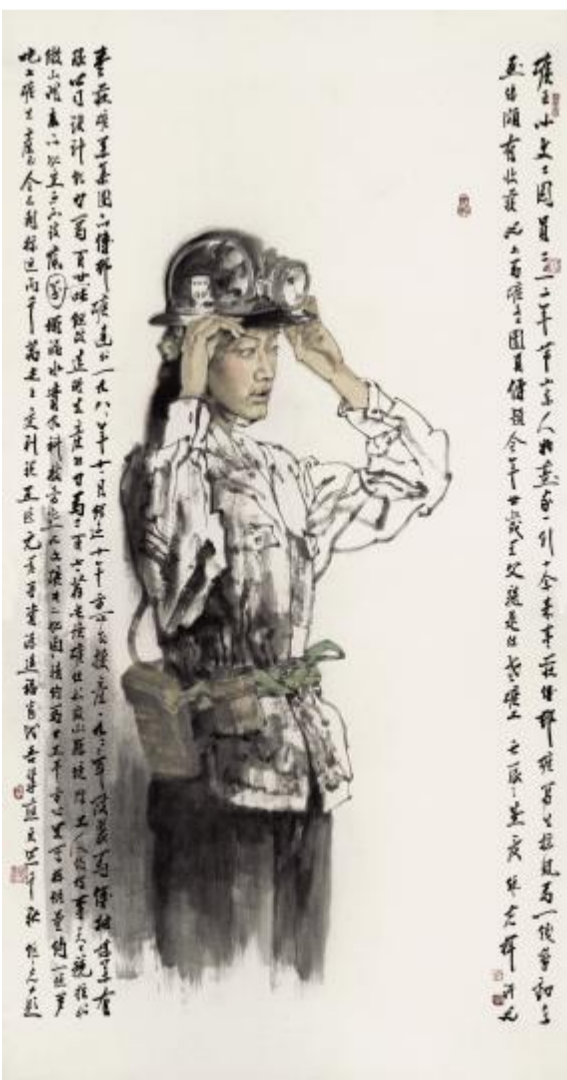
时代颂歌——矿工水墨写生之二·文工团员

代表作《孔子周游列国图》、《公车上书》、《沐》、《杏坛讲学》、《高士图》、《白英点泉》等在国际大赛和全国美展中分别获金奖、铜奖、优秀奖、荣誉奖。文集《砚耕堂随笔》获山东省第三届刘勰文艺理论奖;主创作品《不抛弃不放弃》(合作)入选第三届北京国际美术双年展并获山东省第二届泰山文艺奖一等奖。先后在北京、深圳、中国台湾等地以及日本、新加坡、美国、韩国、奥地利、法国、德国、澳大利亚、新西兰举办联展和个展。国内外许多重要学术刊物均做过专题报道。作品及传略被收入各类画册和辞书。代表作数幅入选国家美术出版工程《中国现代美术全集》中国画卷、壁画卷、插图卷。先后出版画集、文集、书法集、写生集等20余种。被中国收藏家协会列入“中国首届收藏界排行榜——十大画家之一”。