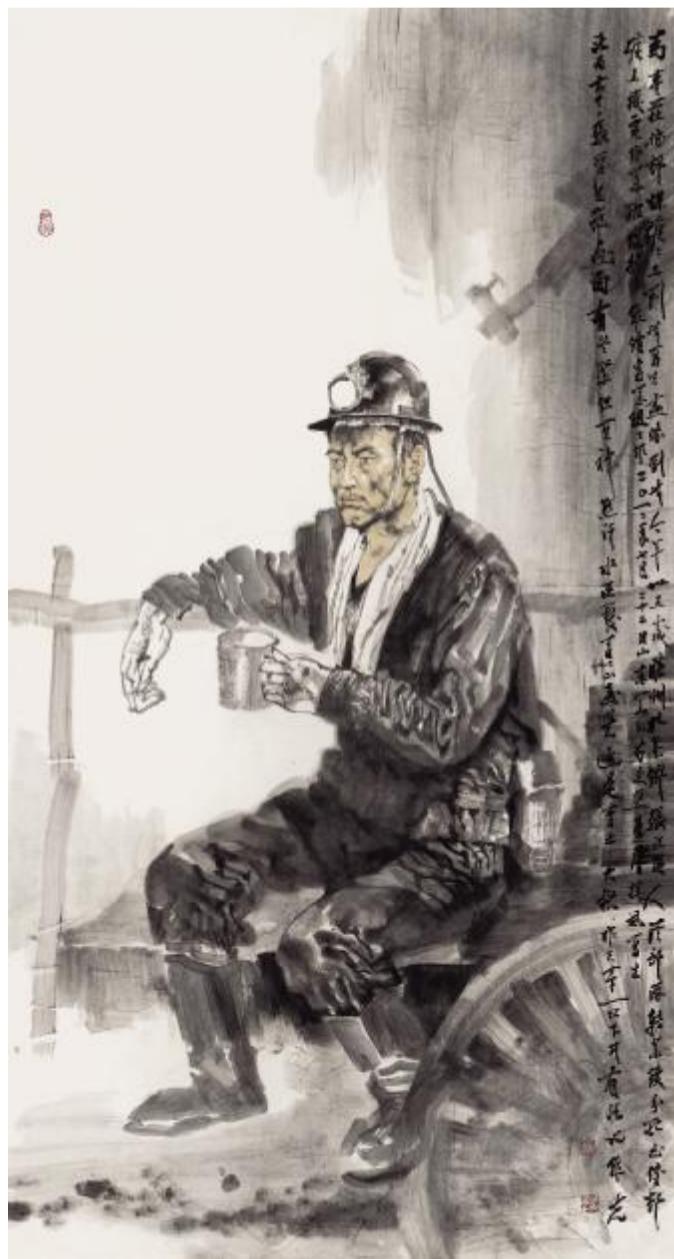
时代颂歌——矿工水墨写生之一·掘进工