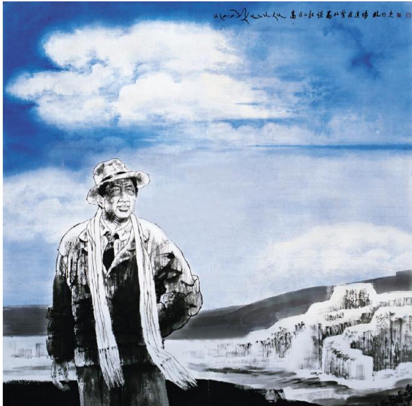
高原的记忆——党的好干部孔繁森

尤其是在人物形象的塑造和主题意境的深化方面,孔维克准确把握历史事件的思想内涵,用传统笔墨表达重大历史事件,在众多人物的组合和画面的整体架构上都有非常大的突破。如在《公车上书》的创作上,孔维克反复地画,在年轻的时候就画过,后来在作为国家重大题材美术创作工程创作中又把作品深化了,使作品提升到一个新的高度。在重大题材创作评选中,大