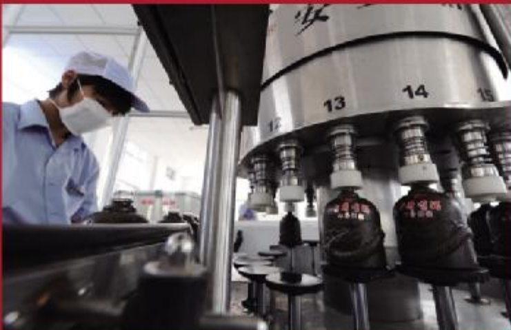
古井贡酒·年份原浆的流水线灌装生产过程