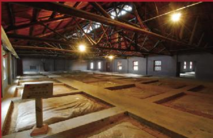
源自明代正德十年的明代窖池群

今年8月，古井贡酒再次摘取中国企业品牌最高荣誉，荣膺2012品牌中国华谱奖、酒行业金谱奖。古井贡酒获此殊荣，正是其白酒主业销售额连续四年持续高速增长率，在白酒行业迅速崛起，是其品牌影响力的全面体现。