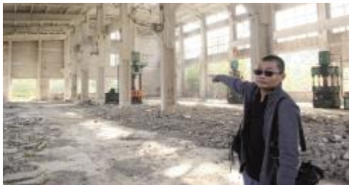
昔日厂房变成一片废墟

7000 万元的损失令一家改制企业濒临绝境。在企业向政府承诺“不做法律之外的事”背后，是中小企业发展权益如何才能得到维护的思考。