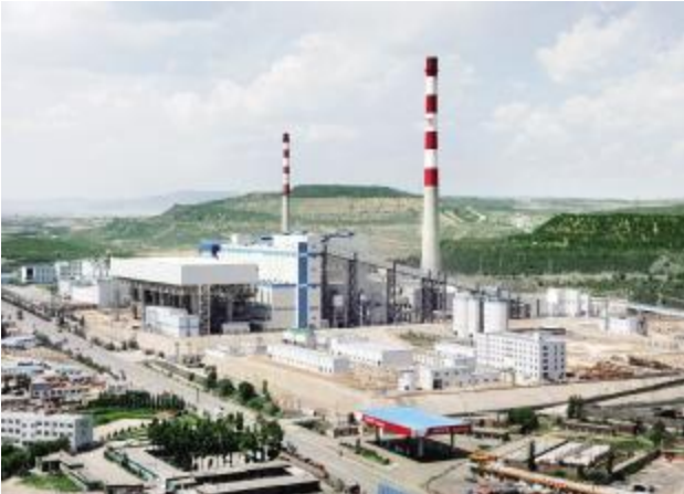
中煤平朔煤矸石电厂