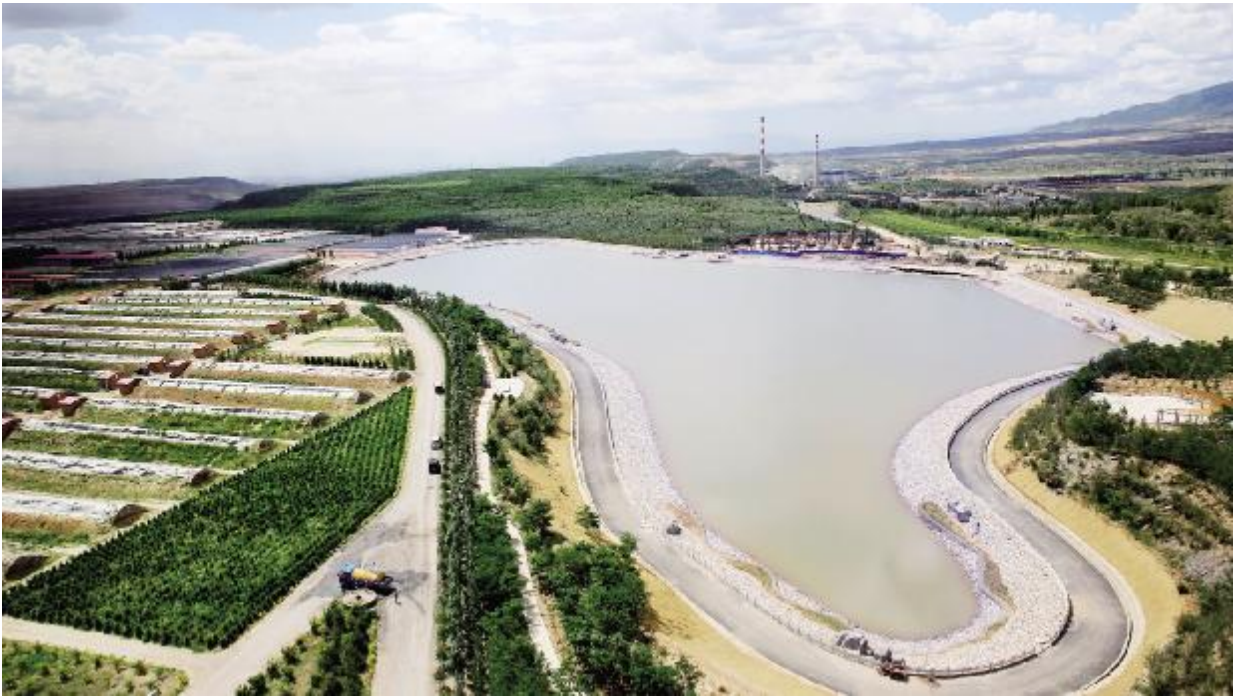
中煤平朔生态示范区景观

这个“试验田”的称号,是否依旧适用于今天的中煤平朔,又将为中煤平朔的转型升级带来什么?