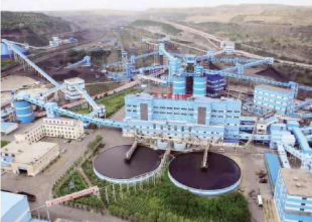
中煤平朔安太堡露天矿区

正如中煤集团党委书记、平朔公司执行董事伊茂森表示,中煤平朔发展的愿景是打造成中国煤炭企业的“北斗星”。