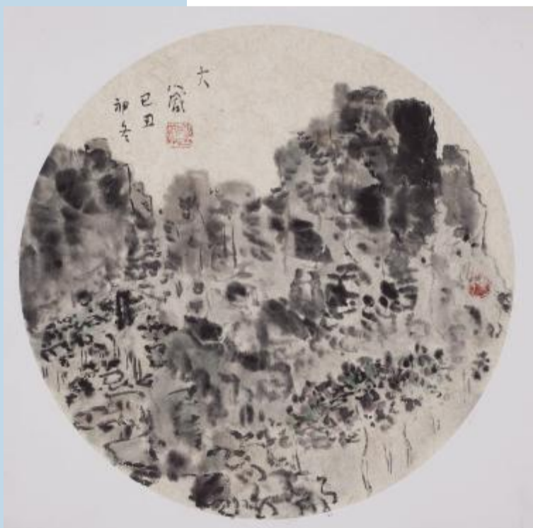
《聚》卡纸/水墨 40cm×40cm 2009