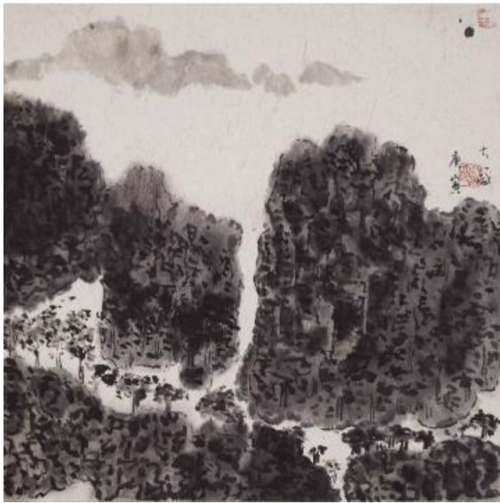
《对峙》卡纸水墨 40cm×40cm 2010