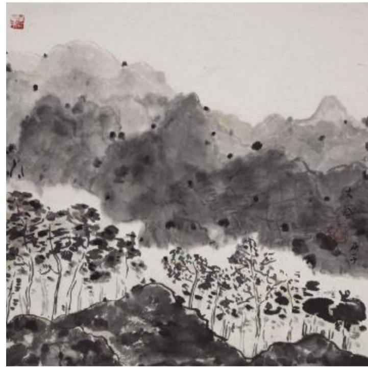
《风铃》卡纸水墨 40cm×40cm 2008