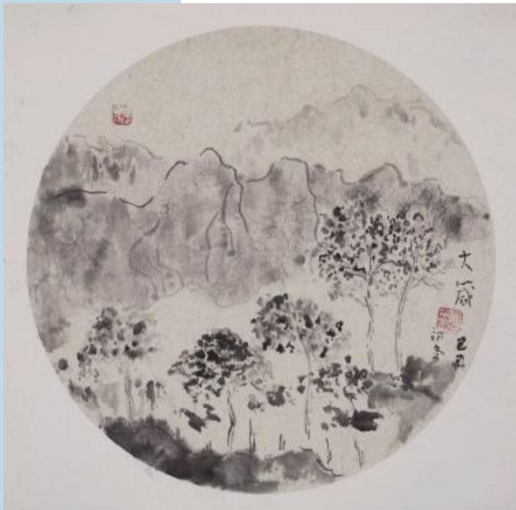
《静思》卡纸/水墨 40cm×40cm 2009