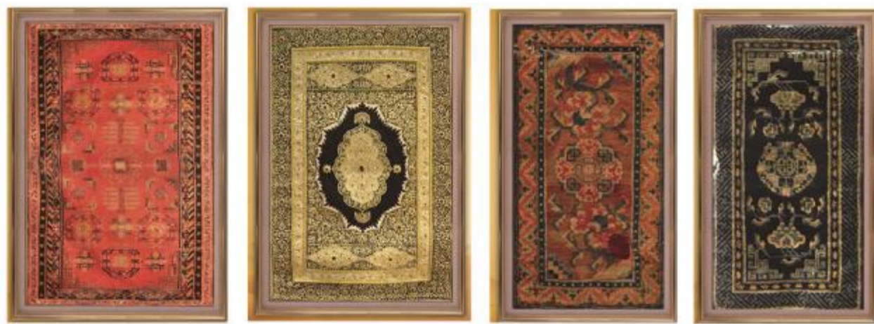
依次为新疆古董地毯、宝石地毯、宁夏古董地毯、和田古董地毯

毯具有平穩性而不能有过多的波浪形曲线和起伏,考虑到使用者的眼睛与毯面距离过于接近,纹样不易过于空和粗犷;加之伊斯兰教国家和地区多处于干旱沙漠地带,人们长期处于单一环境中,需要通过细密的装饰风格进行视觉互补。