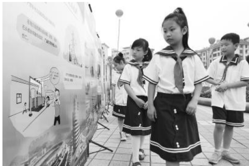
安全文化展板前,小学生们纷纷驻足观看。

的幸福,历来是家长操心、学校担心、社会关心的大事。”作为校园安全文化的一项重要内容,希望通过用电安全知识普及教育活动的开展,能更好地把“教育一个孩子,带动一个家庭,影响整个社会”活动推向深入,以达到加强安全教育管理,构建安全文明校园的目的。