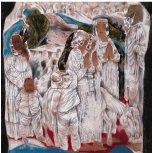
《童年曲》绢本设色 138cm×138cm 1995年

唐勇力的艺术创作中采用的是意象造型,他的画是具有意象思维属性的一种工笔重彩。一般说来,工笔特别容易画得很写实,如果画得非常写实,就过于西方化了,西方的思维方式过重了。而唐勇力是很有分寸的,他在创作思维中把中国美学思想引入到自己的艺术表现里面,把现实和想象沟通起来。