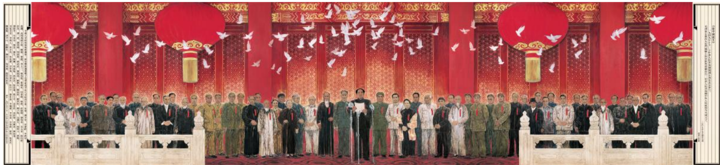
《新中国诞生》绢本·矿物色 200cm×800cm 2009年