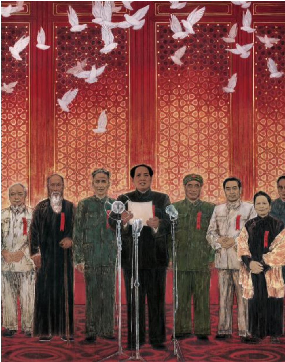
《新中国诞生》(局部) 绢本·矿物色 2009年

唐勇力早年毕业于河北师大,后留校任教,1982年曾于中央美术学院进修,1984、1985年考入浙美研究生,