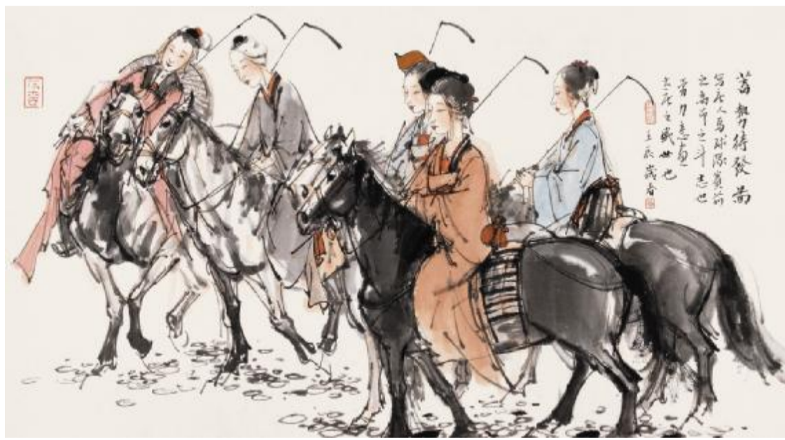
《蓄势待发图》纸本设色 24cm×43cm 2012年