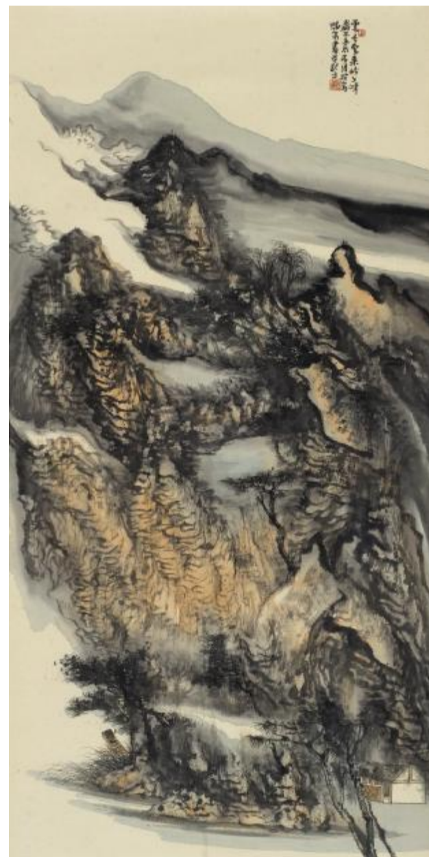
云去云来岭上峰 168cm×36cm 2012年