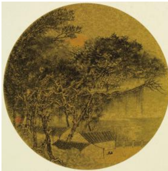
团扇(二) 30cm 2011年