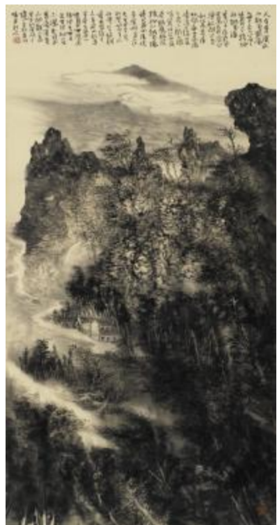
家住苕溪 136cm×68cm 2011年