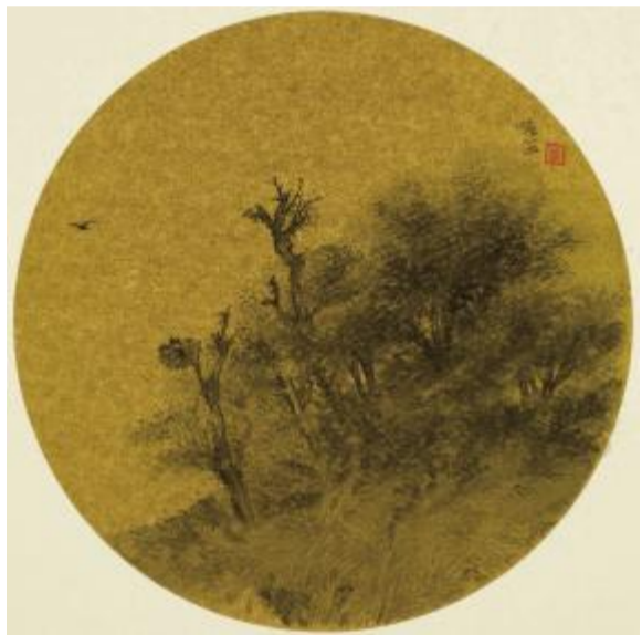
团扇(一) 30cm 2011年