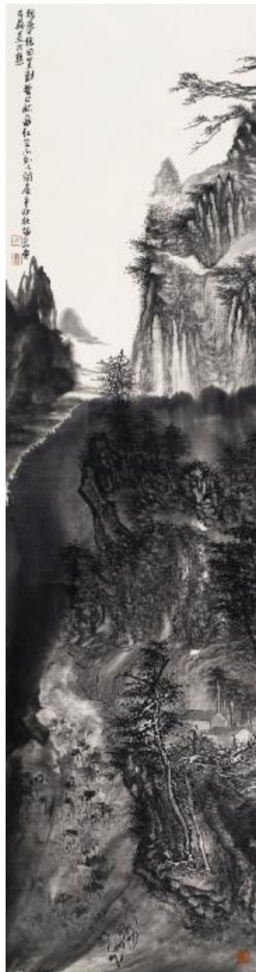
短梦惊回 183cm×48cm 2011年

主要个人画集有《中国美学家——李晓松山水画卷》、《当代著名画家技法经典——李晓松之古风今雨》、《水墨平台》、《美图生活》、《中国画收藏文献——李晓松卷》、《当代逸品十家——李晓松卷》、《当代实力派画家李晓松山水画卷》、《古风今雨——李晓松山水画卷》、《心灵的图式——李晓松山水画卷》等。