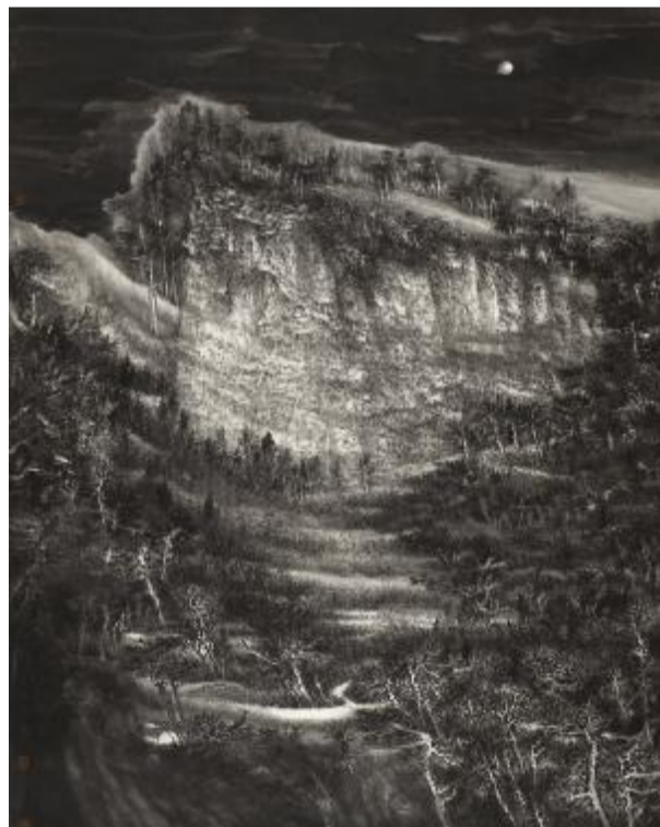
清月出岭光入扉 180cm×143cm 2011年