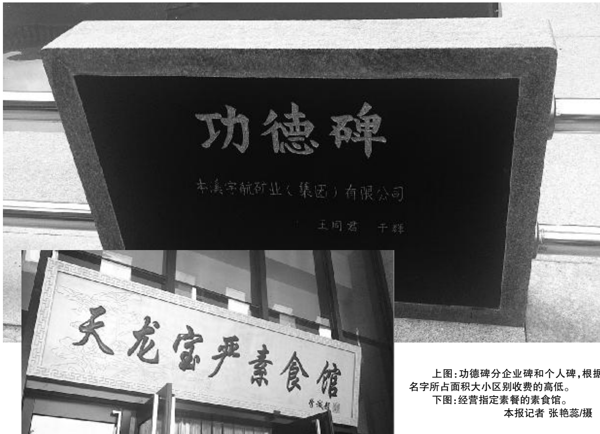
上图:功德碑分企业碑和个人碑,根据名字所占面积大小区别收费的高低。 下图:经营指定素食的素食馆。

法门寺风景区是西安曲江文化产业投资(集团)有限公司参股并控股企业,因此,岳路平把法门寺风景区也归为曲江系。“曲江系的人说我们的观点不过是一些专家、学者的局部意见,片