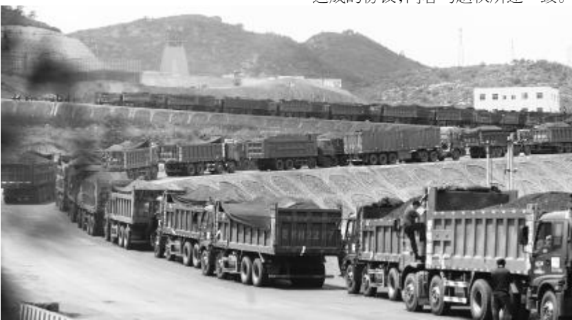
在山西,大车不缺活干

沿线的顺安宾馆,对正在接受《中国企业报》记者采访的车主说:“庞大汽车来了四五辆小车,今晚要盯紧点,防止他们抢车,要么就在车子前后挖上壕沟,让他们开不走!”