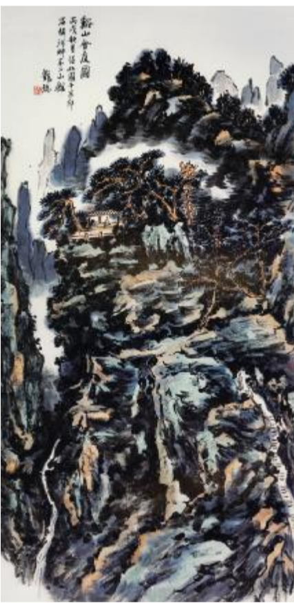
溪山会友图 136cmx68cm 2006年