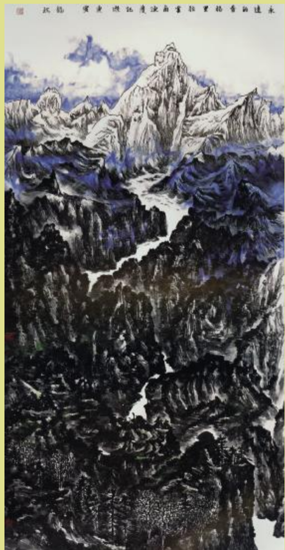
永远的香格里拉 239cmx122cm 2010年