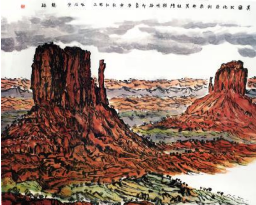
美国峡谷印象 144cmx183cm 2010年

龙瑞从中国国家画院院长岗位上卸任后,将更多的时间和精力投入到艺术创作中。几年来,他的山水大作更有着明显的回归传统、高扬传统从而超越传统的特征。这些作品不仅幅面巨大、气势