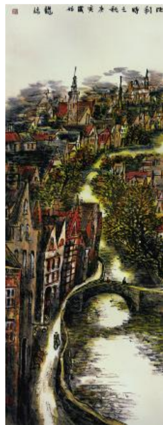
比利时之秋 182cmx69cm 2010年