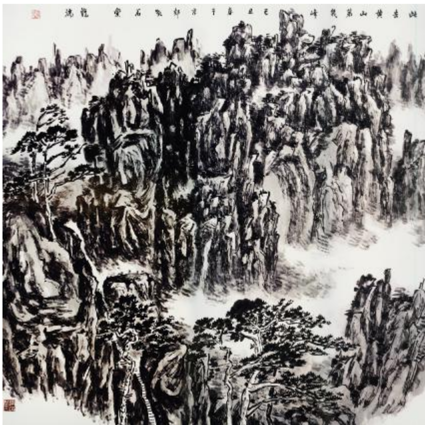
此去黄山第几峰 124cmx124cm 2009年