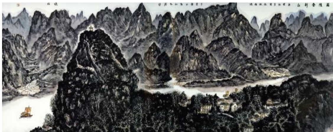
雨后叠彩山 144cmx368cm 2010年

(王健林,大连万达集团股份有限公司董事长。中共十七大代表、全国政协常委、全国工商联副主席、中华慈善总会荣誉会长;中国企业联合会、中国企业家协会副会长。大连万达集团于2011年4月在中国美术馆承办龙瑞画展。)