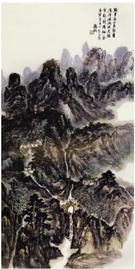
黔东南山色 136cmx68cm 2010年