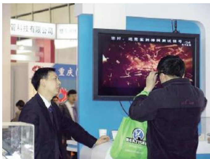
中国普天信息产业集团公司 除了“通信网络”、“物联网”,“三网融合”成为普天展台重点

人们期待中央企业通过深化自身的文化建设进一步推动行业文化发展,并在行业文化发展过程中进一步发挥引领作用。运用文化建设构建企业价值体系,不断推动企业文化理论研究向纵深发展。加强以企业价值体系为核心的企业文化建设,是建设社会主义核心价值体系的根本要求,也是提高中央企业核心竞争力、增强软实力的战略举措。