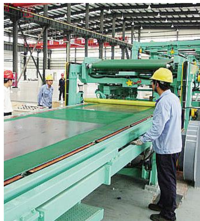
中国林业集团公司 中林集团进一步增强集团公司在林业行业的控制力、影响力和带动力,为加快我国林业产业发展做出应有的贡献