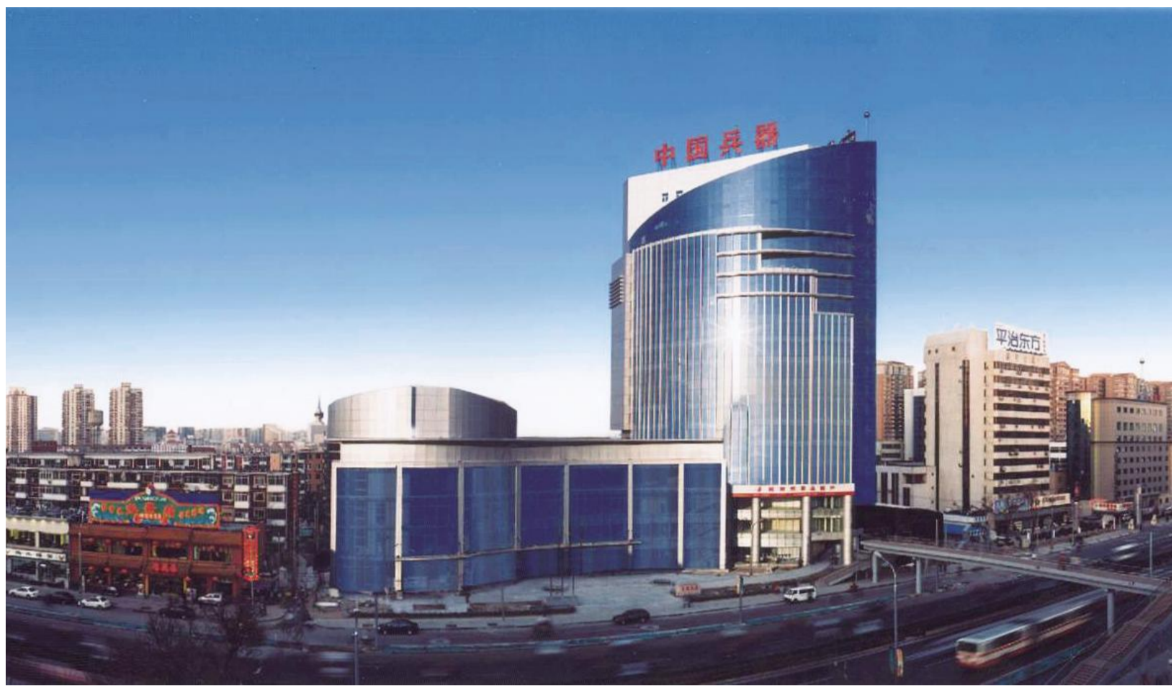
中国兵器装备集团公司 位于北京市紫竹桥西的中国兵器总部

行业文化是以行业历史文化为基础,在行业发展过程中逐渐形成的为行业内员工所普遍认同并自觉遵循的一系列理念和行为方式的总和。行业文化是建立在行业内企业个性文化基础之上的行业共性文化,行业内各企业的文化建设是行业文化形成的源泉。在我国,由于中央企业往往成为所属行业的领头羊和排头兵,多年来通过自身的企业文化建设,为行业文化建设作出了突出贡献。