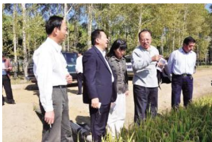
中国农业发展集团总公司 公司领导深入基层调查研究