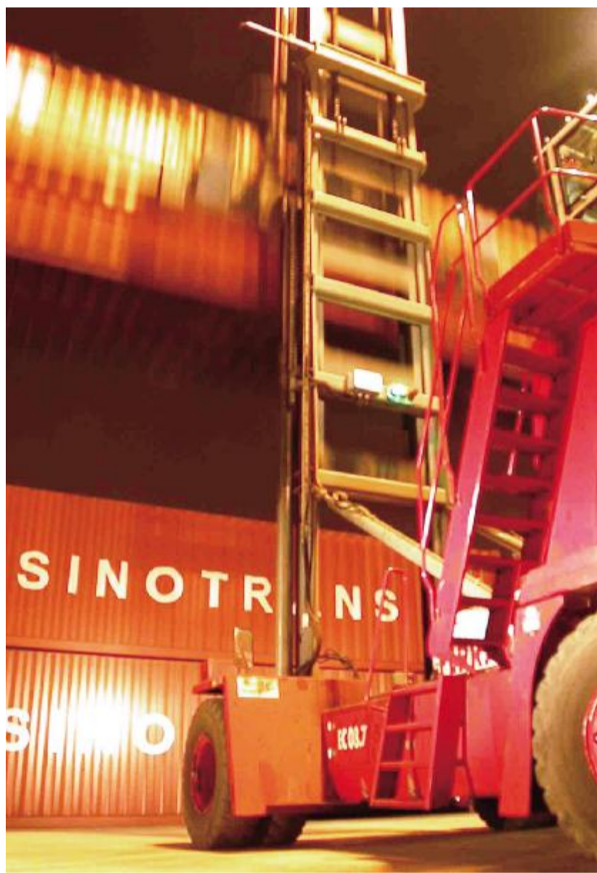
中国外运长航集团有限公司 夜晚繁忙的施工作业现场