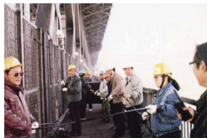
武汉邮电科学研究院 员工进行施工作业