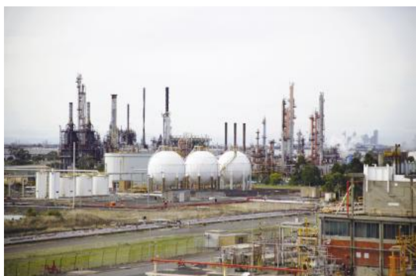
中国化工集团公司 公司厂区