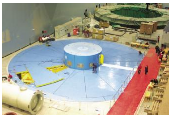
中国能源建设集团有限公司 中国能建安装的我国首台巨型蒸发冷却机组试运行