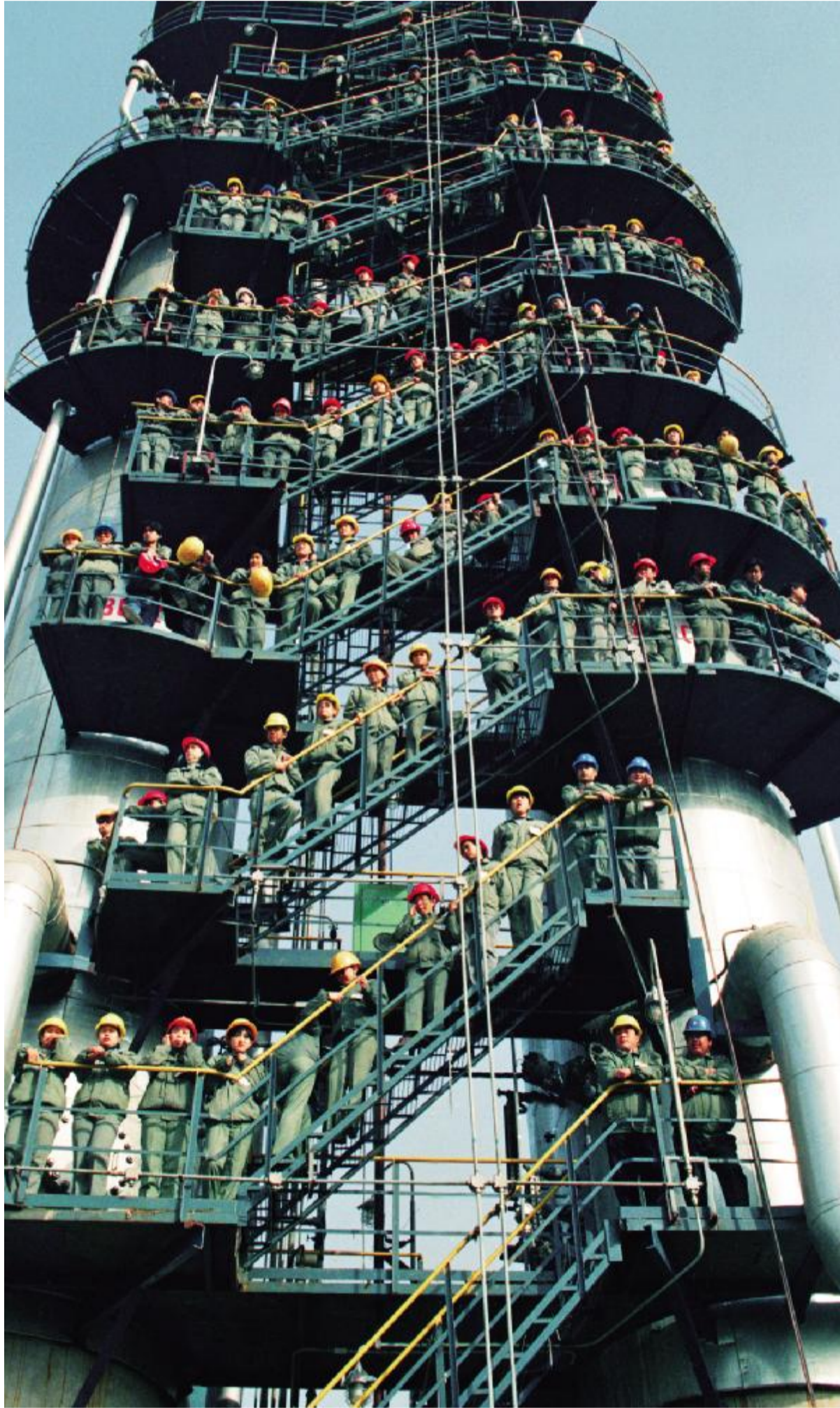
中石化 抓住境外资金流动性充足、利率处于历史低位的机遇,加大境外融资力度,有效降低了财务成本