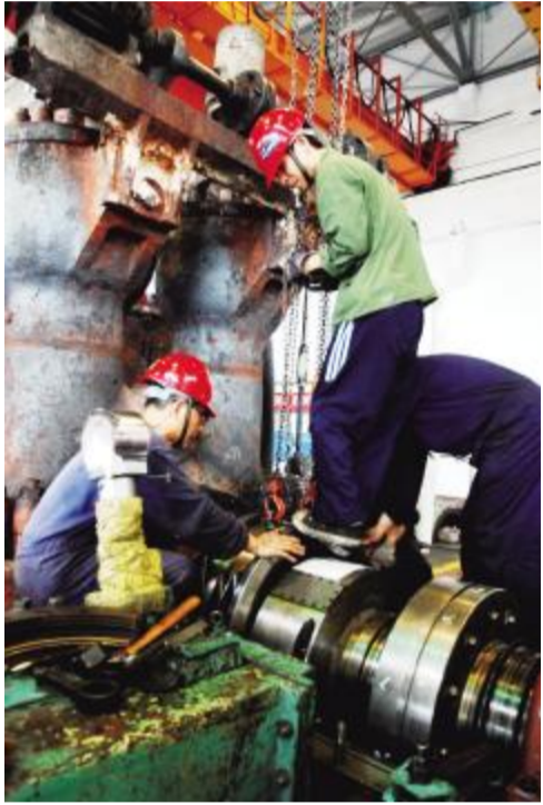
中国国电 优化投资结构,优先向新能源、优质煤炭开发等项目倾斜