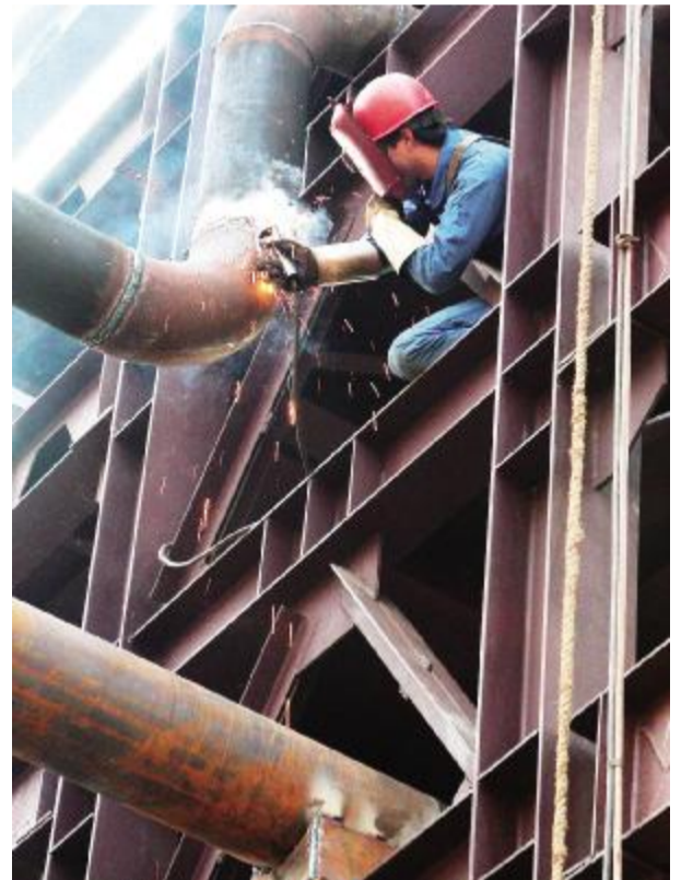
中冶集团 根据实际情况停止了部分计划投资项目