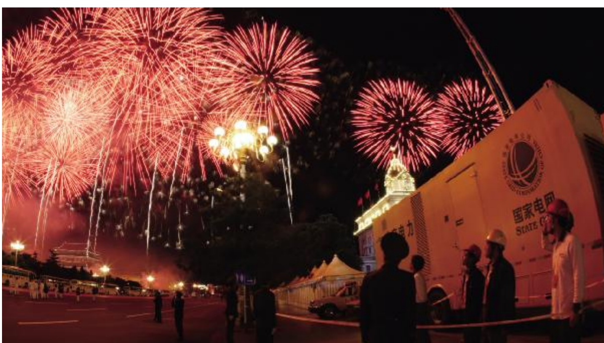
国家电网 建立“三集五大”管理体系,资金归集率保持在99%以上,集中采购比例超过90%