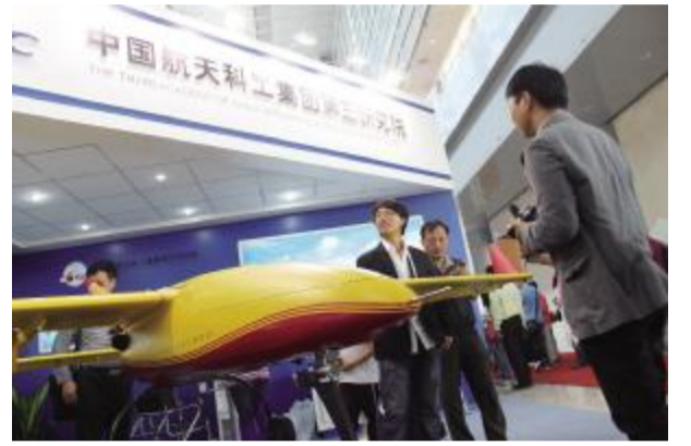
航天科工 对下属单位逐户测算应收账款、存货及亏损企业亏损额,并提出明确控制目标