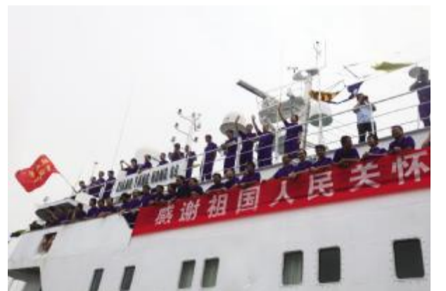
中船重工 采取切实措施减少存货占用,加速应收账款回收