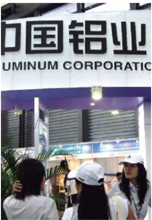
中铝公司 强化基础管理,实施运营转型,各项消耗指标大幅降低