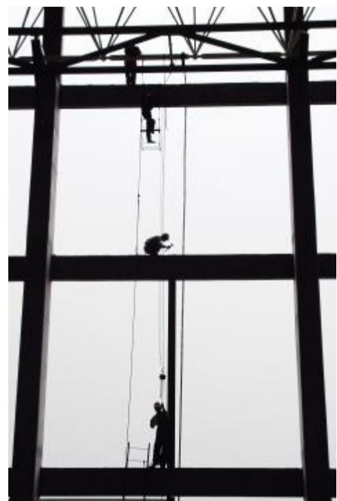
中国华电 深入开展每日经济利润分析,对电量、煤价、煤耗等主要指标进行分析对标