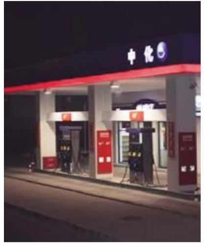
中国中化 坚持以价值创造为中心,积极推进战略和经营转型,加强风险管控,不断自身优化,培养核心竞争力

欧美债务危机、金融市场动荡,全球经济形势的不明朗和诸多不确定因素,为央企带来了相当大的压力和不利影响。同时,市场需求的疲软,信贷政策持续收紧,导致企业生产成本上升,经营风险加剧。如何正确认识全球经济形势的复杂性和竞争变局,在未来的发展中突出转型升级、降本增效和 risk 管控,正考验着中央企业的经营智慧。中石化、国家电网等一大批央企积极强化管理创新、开源节流、降本增效,并通过在全球市场谨慎全面地评估,对投资计划和投资项目进行系统地调整,实现了成本有效压缩、资源的科学配置,确保了企业平稳运行。