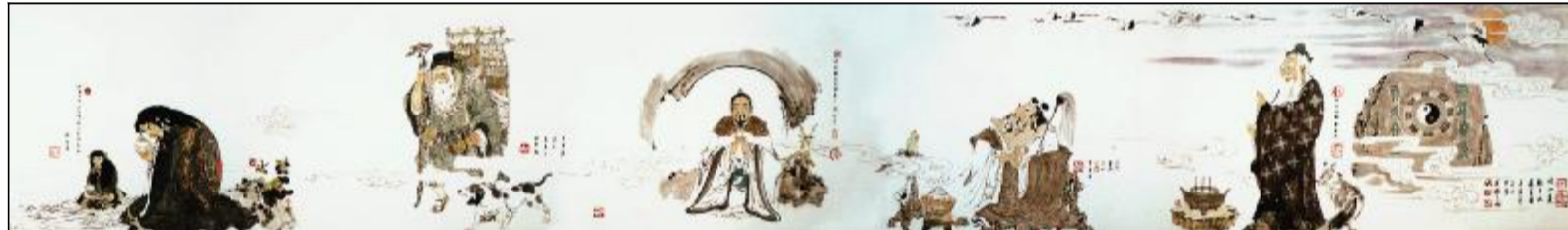
《崂山道教十大道首》935cmx70cm(局部)

《道德经》开篇:道可道,非常道。名可名,非常名。也许博大精深的道教文化原是不可解读的,说出来,就错了。那么,我闭嘴,请您敞开心扉,去体悟吧,就这样。