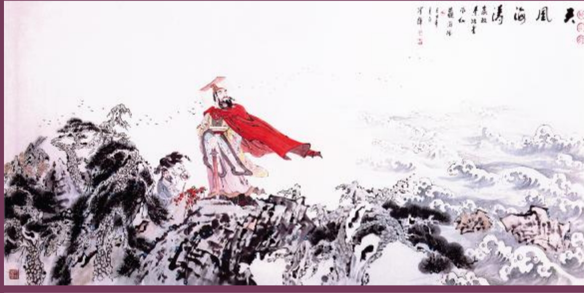
《大风海涛——秦始皇入海求仙图》250cmx126cm