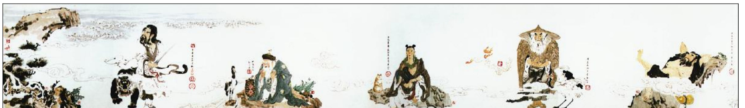
《崂山道教十大道首》935cmx70cm(局部)