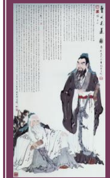
《圣人之道——历代文武之尊孔子与孙子》98cmx180cm