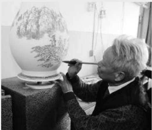
安徽美术家协会名誉主席 郭公达