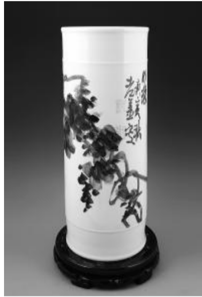
清华大学特聘教授、 中国艺术研究院博士生导师 姜宝林《明珠》

进入二十一世纪,中国的经济、文化都有了气象更新的发展,同时也受到西方现代文明和文化艺术的影响及冲击。如何满足现代人们精神需求和审美趣味,同时为后代留下新的精神财富,一些卓有成就的艺术家也开始关注中国传统的青花瓷,用中国水墨绘画艺术展现在中国的瓷器上,形成独特的艺术风格。新的载体艺术,艺术家也有了更广阔的创造空间,是现代陶瓷与绘画完美的结合表现形式,瓷画作形成别具一格的自然之美,不仅得到名家们的喜爱,同时也得到了越来越多的收藏家的