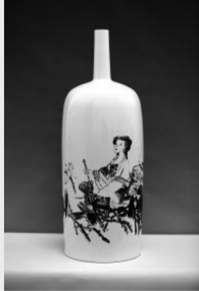
吴光浦《宋人词意图》