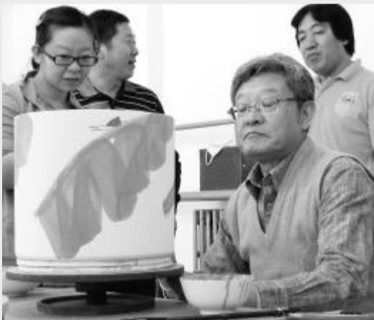
清华大学特聘教授、中国艺术研究院博士生导师 姜宝林