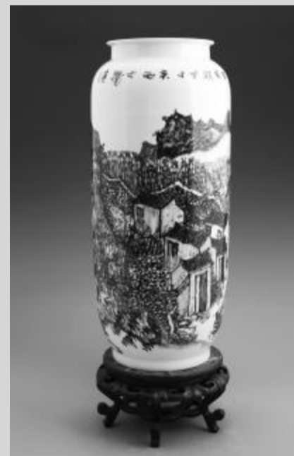
李国超《瀑底下秋韵》