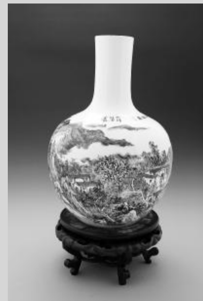
郭金服《溪山清逸图》