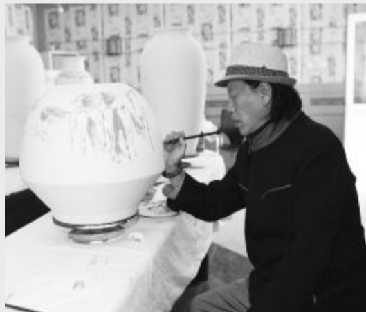
中国美术家协会副主席、班禅画师 尼玛泽仁