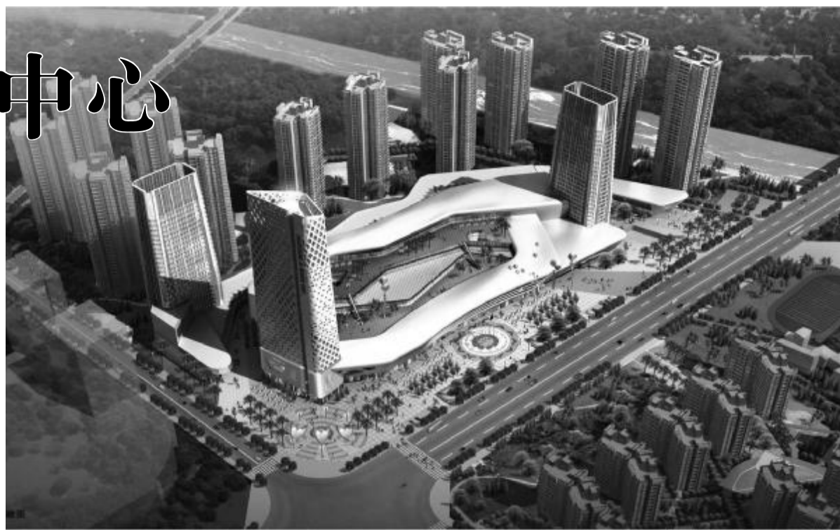
未来的天津塘沽海洋高新区商业区

总部经济聚集区,充分发挥地理位置、交通体系优势,研究制定产业扶持政策,加大招商力度,汇集各类企业总部、研发销售中心。