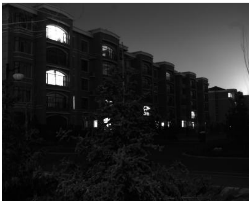
11 月 27 日晚,一位当地人说:“康巴什的房子到了晚上几乎没有亮灯的,很冷清。”这句话折射出鄂尔多斯楼市极大的空置率。