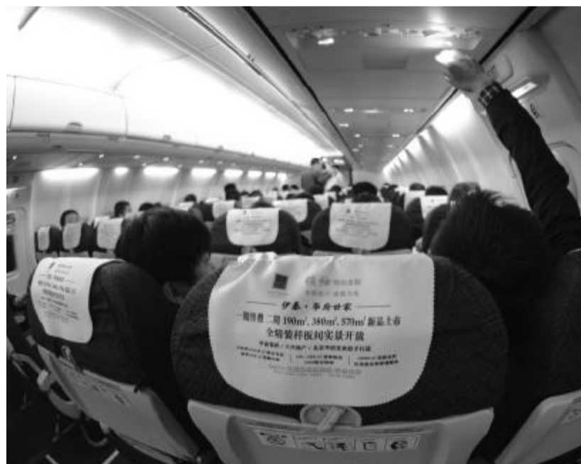
作为经济迅速发展的城市,鄂尔多斯的房地产市场一度极为繁荣,售楼广告几乎随处可见,航班上也不例外。

一位貌似这位老板的老婆说,“去年白菜卖到 2 块多,菠菜五六块钱一斤,今年还算便宜很多了。”