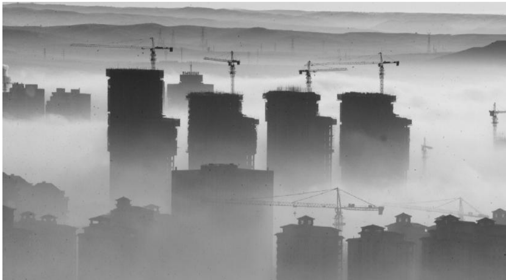
迷雾中的鄂尔多斯康巴什新城

康巴什,这座在荒漠上投资 170 亿元兴建的新城,占地 32 万平方公里,总竣工面积达 672 万平方米,却因人烟稀少而倍感冷清。本报刊发《鄂尔多斯“鬼城”崩盘》一文后,引起社会高度关注。26 日,《中国企业报》记者飞赴鄂尔多斯再次采访调查。