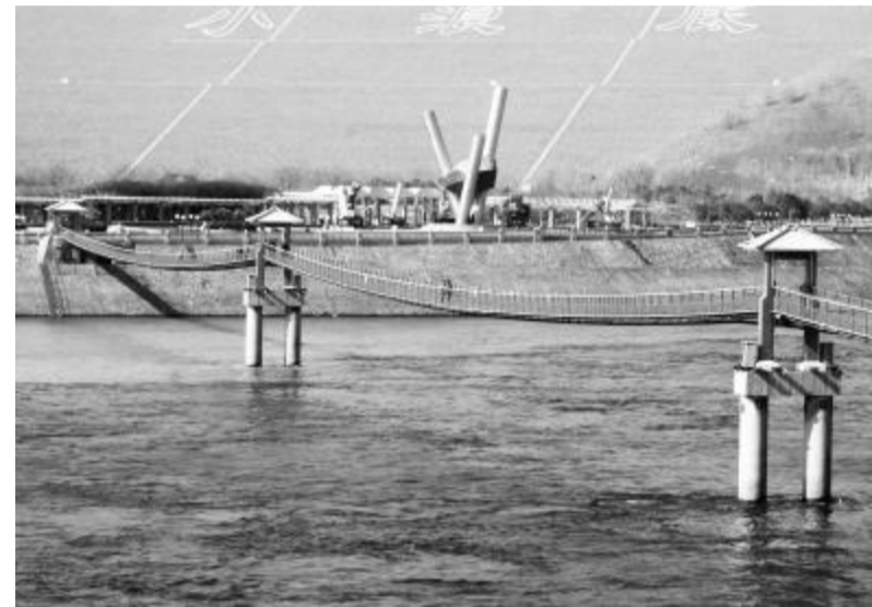
河南省济源市的黄河小浪底水库启动应急抗旱措施,下泄流量增至 900 立方米每秒

农田水利建设滞后仍然是对农业稳定发展和粮食安全的重要制约。大多数水利工程靠吃老本,“用的是大跃进的水,种的是学大寨的田”,3000 多万亩耕地仍然“望天收”,粮食持续稳定增产的后劲不足。水利设施薄弱。大量田间工程“上级投入少,基层投不起,农民干不了”,水利设施