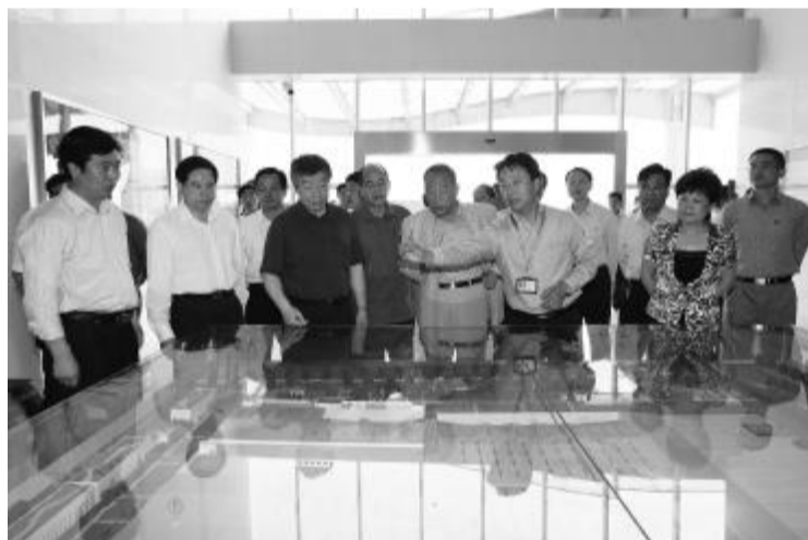
原中央政治局委员、中央军委副主席曹刚川(前左四),河南省委书记、省人大常委会主任卢展工(前左三)在漯河太古可口可乐饮料公司调研

2010 年开发区规模以上企业实现主营业务收入 550 亿元,增加值 80 亿元,税收收入 19.2 亿元,分别增长 32.1%、25.5% 和 26.3%。主要经济指标的绝对量和增速在河南省开发区保持领先地位。