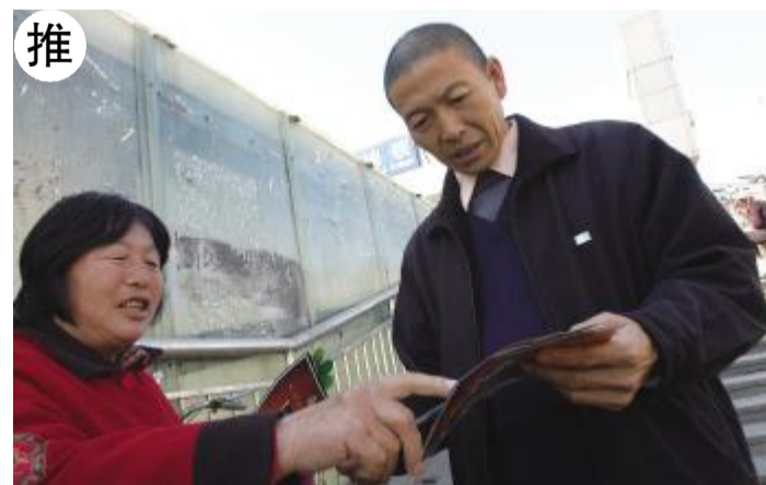
降价潮使得开发商急于推销，一位受雇于某楼盘的大妈在地铁出口向客人散发宣传单。