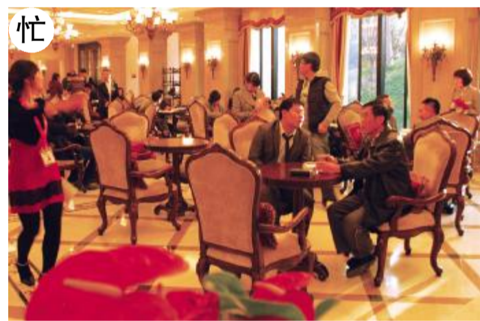
在降价幅度大的楼盘，前来咨询的客户很多，销售人员忙得团团转。