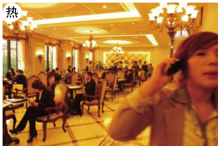
左图:11月7日下午3点，通州华业东方玫瑰售楼处内，前来咨询的客户寥寥无几，售楼小姐无事可做。