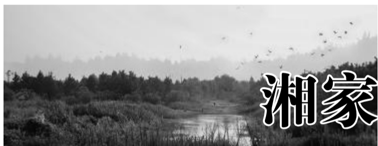
暮色鸟归来

本届火炬传递活动以绍兴作为圣火传递的首站顺利传递后,将相继在金华、衢州、丽水、温州、台州、舟山、宁波、湖州和杭州举行,并将在10月11日的八届残运会开幕式上点燃主火炬塔。(陈春晓)