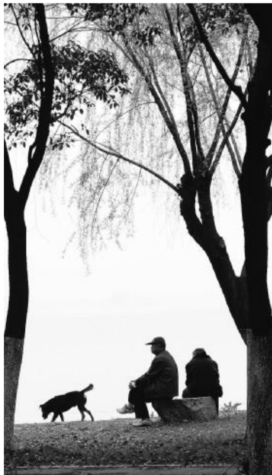
湖畔小憩