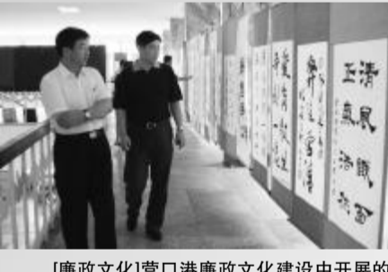
[廉政文化]营口港廉政文化建设中开展的防腐倡廉书画展