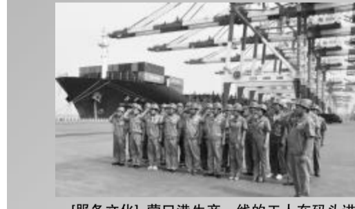
[服务文化]营口港生产一线的工人在码头进行“店小二”服务承诺宣誓