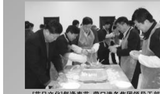
[节日文化]每逢春节,营口港务集团领导干部都要为工人包过年饺子

C系列项目是中航工业第一个与国外风险合作的民用飞机项目,中航工业沈飞参与项目的研发设计、制造、集成及相关的试验和售后服务,并支持机型适航取证工作。2008年7月,沈飞与加拿大庞巴迪飞机公司在英国范堡罗国际航展上签署该项目合同,为沈飞成功跻身世界先进的航空制造领域,拉动沈阳地区经济的发展,提供了一个强大的风险合作平台。该项目的成功实施,将在沈阳地区打造一个具有研发、试验、制造民机的重要基地。2009年4月,C系列飞机项目首段试验件开工,项目研制中,成功运用并行工程模式,实现从详细设计开始,到最终产品包装发运,共计11个月研制周期,比以往提前3个月交付首段试验件,为下一步飞机总体结构设计奠定了基础。2010年3月,C系列项目装配厂房在沈阳航空高新技术产业基地奠基。两个月后,沈阳沈飞国际商用飞机有限公司举行了揭牌仪式,标志着中航工业沈飞实现由传统民机转包生产向风险合作伙伴转型升级的飞跃,民机产业的“两融”迈出了实质性步伐。