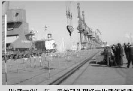
[比武文化]一年一度的码头现场大比武练绝活