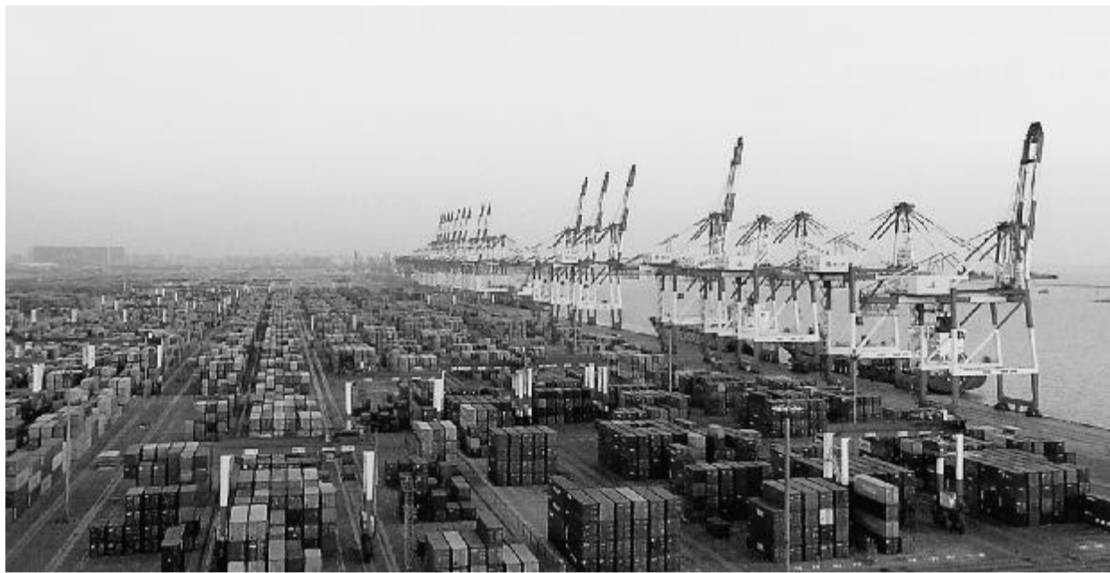
壮阔的营口港集装箱码头