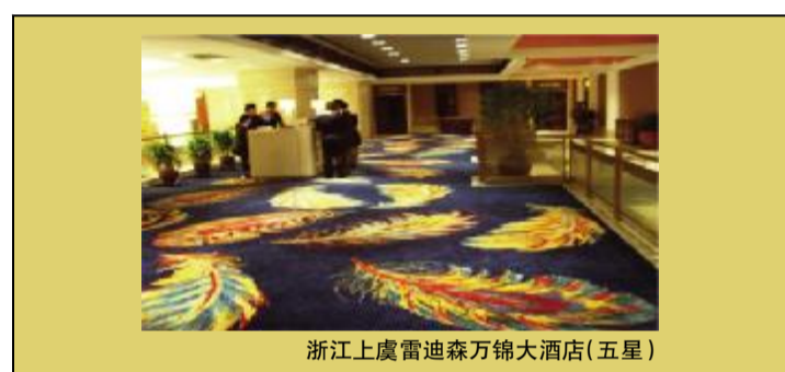
浙江上虞雷迪森万锦大酒店(五星)

多 年来,秉承着“荣耀,在于超越”的东方人,恪守着“传承东方文化、缔造品位生活”的承诺,始终不渝地把品牌作为企业的生命,坚持走以质取胜、靠品牌兴企之路,公司在先后荣获“山东十大竞争力品牌”、“山东省著名商标”、“山东名牌”、“中国地毯行业十大影响力品牌”、“中国环保地毯”、“中外酒店十大白金品牌供应商”等荣誉称号之后,依托良好的信誉和精湛的技术,又荣膺“中国驰名商标”桂冠,其综合经济指标挺进全国地毯行业前三甲。