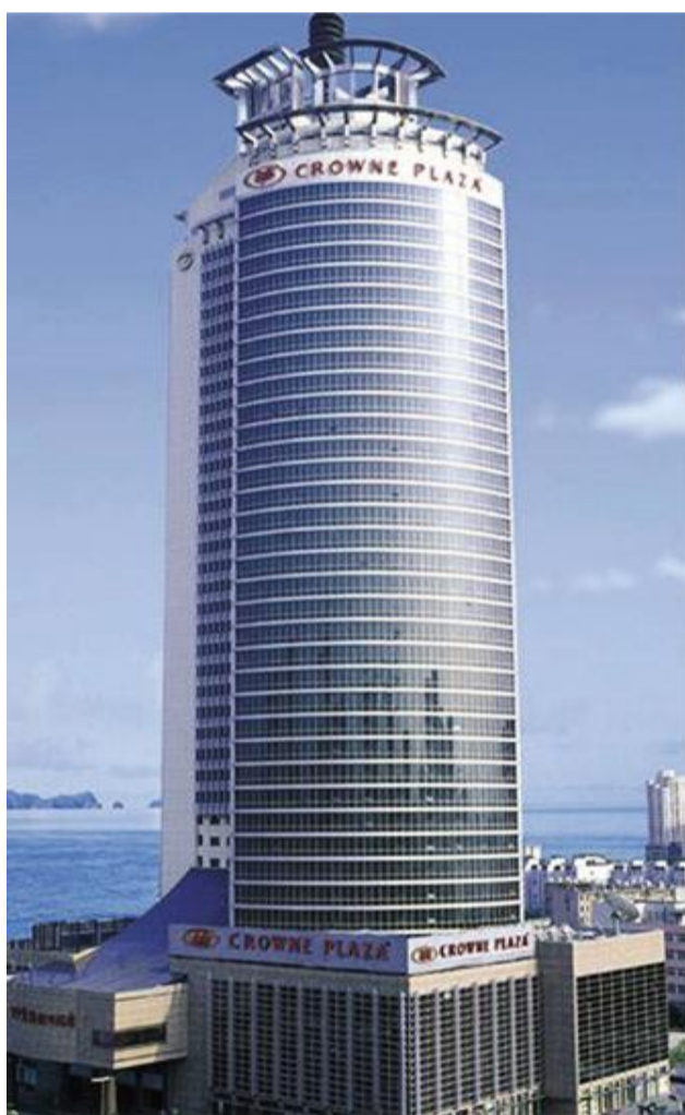
青岛皇冠假日酒店(五星)