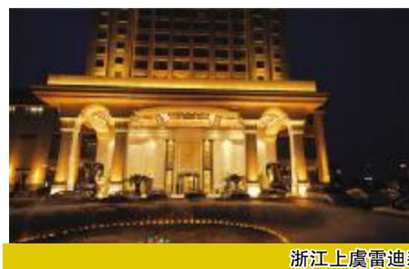
浙江上虞雷迪森万锦大酒店(五星)

“东方”地毯不仅先后为人民大会堂会议中心、上海大剧院、澳门君悦酒店以及北京饭店贵宾馆、无锡万达喜来登酒店、卡塔尔 Marriott Hotel 等国内外高端需求和北京 2008 奥运工程提供服务,而且与日本 NITORI 公司、美国 CAPEL 公司等国际地毯巨头建立了良好的合作关系,成为中国万达酒店集团优秀供应商。工程用、商用、民用,等等,“东方”地毯涉及的应用领域越来越宽泛,加上遍布全国的办事机构连接成发达的营销网络,产品远销美国、加拿大、中东、东南亚、日本、韩国、中国港澳台等几十个国家和地区,在国内外市场上享有极高的声誉。