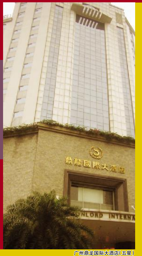
广州鼎龙国际大酒店(五星)

“挑战极限,追求完美”,公司始终致力于高端研发、产品创新,力求在涉足地毯业的每一个环节上都做到尽善尽美、精益求精。公司从成立之初就同步推动 ISO9001:2000 质量管理体系认证,并一次性通过 ISO14001:2004 环境管理体系认证。公司自主研发的高档高密度提花地毯荣获山东省科技进步奖、纺织行业新产品奖;将新型材料 PTT 用于机织地毯技术,填补了国内空白;研发的奥卡利系列产品被中国纤维检验局批准使用天然/生态纤维制品质量专用标志,实现了使用此标志产品零的突破。目前,集团自主研发产品达 1000 多个。凭借着雄厚资金实力,集团又引进了当今国际上领先的奥地利高速印花机、16 色英国阿克明斯特织机、日本全能簇绒织机、德国圣豪公司的高档电脑提花剑杆织机和尼龙匹染机,可生产各种质地的高档工程地毯及豪华工艺块毯。