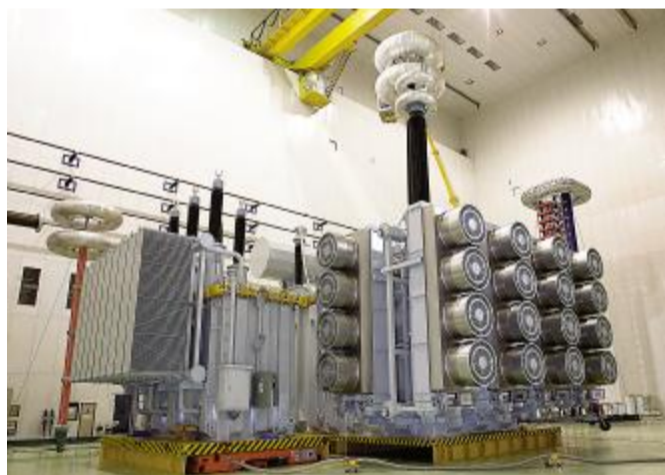
2010年9月,研制成功世界首台1000kV/1000MVA双柱结构特高压自耦变压器

近年来,西电集团围绕国家重点工程和市场需要,不断加大科技研发投入,累计完成自主开发研制的重点新产品1500余项,其中达到国际先进水平的391项,国内领先水平274项;获国家级科技成果奖14项;取得授权专利707件,软件著作权2件。目前,西电集团已有5项主导产品获得了中国名牌产品称号,同时还获得陕西省名牌16个,西安市名牌19个,各相关技术研发水平均处于国内领先、国际先进地位,并形成了自主知识产权。多年来,西电集团始终保持着国内龙头企业地位引领着行业的发展。