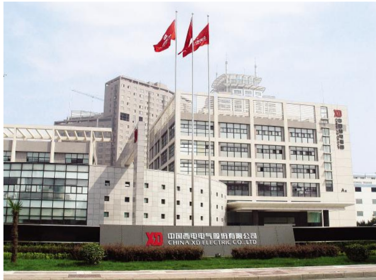
位于陕西省西安市高新区的中国西电集团公司总部

半个世纪以来,西电集团通过不懈努力,成功走出了一条由引进、消化吸收到独立研制的自主创新之路。其产品发展经历了由低等级到高等级,由技术引进到自主创新,由单机制造到成套生产的过