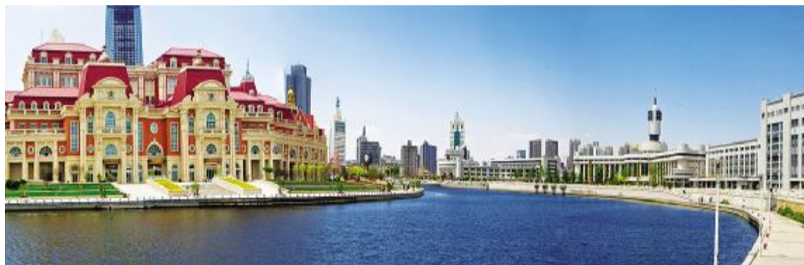
坐落于和平区解放路金融街地区的津湾广场,是天津市20项重大服务业项目之一,是天津金融城的标志性区域。与意大利风情区以及滨海道购物街相邻,隔海河与天津站相对,其周围为天津最出名的经典区。

20世纪初的天津不仅不能跟上海、北京比,甚至不能跟青岛、大连比。河西区的市长楼里退休的老领导们没事就闲侃一阵子:曾几何时天津人还是很干事的,那个时候,天津的城市建设很超前,建桥的时候中央领导们来参观过,给了很高的评价,因为那是全国第一座高架桥。天津还在全国首创了以“三环十四射”为骨架的市区干道系统。后来,由于领导班子不和谐,干部们思想上的框框开始多起来,很多人开始不干事,很多人干事开始喜欢找依据,喜欢死搬硬套的红头文件拒绝干事,这样做做不久,久而久之,人的创新性就没了,这种思想上的惰性和禁锢让天津像一头笨重的老牛,越跑越慢。这种状况一直持续到2007年市委书记张高丽上任天津。