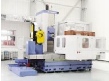
日本三菱卧式镗铣加工中心

华成集团将继续开拓创新、锐意进取、充满激情、科学创业,不断地提升境界、提升层次、提升标准,为未来五年实现百亿华成、带动百亿产业奠定坚实基础,重振老工业区雄风。