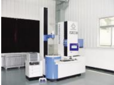
(检测设备)德国克林贝格齿轮检测仪