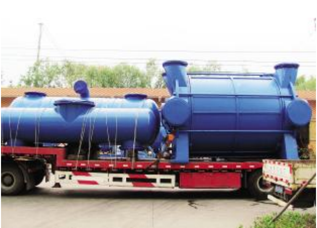
风洞试验用2BEC130特大型水环真空泵