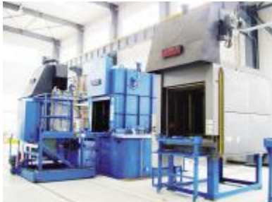
奥地利爱协林热处理生产线

十多年前还是一个严重亏损、濒临破产的小厂,如今已跃居同行业产销量第一位、年产销额达8亿元的现代化企业,这就是山东华成集团走过的发展轨迹。面对即将建成的占地500亩、总投资16.8亿元的华成精密减速机新园区,人们确信,一个世界一流的减速机制造基地正在崛起,华成集团正一步步走向国际大舞台。