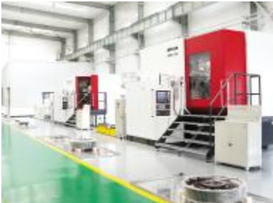
德国霍夫勒数控磨齿机