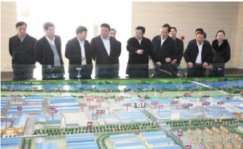
湖南省委书记周强(左5)，衡阳市委书记张文雄(左6)，市长张自银(左4)在白沙洲工业园区运筹谋划、指点发展