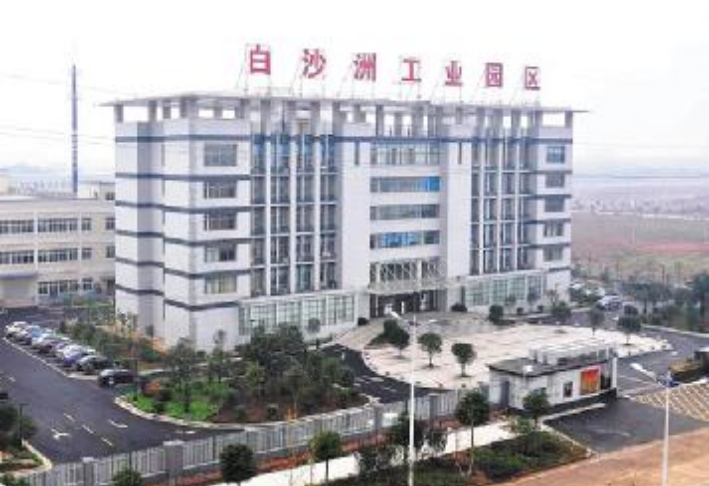
白沙洲工业园区管委会办公楼