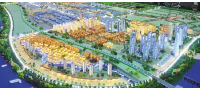
白沙洲工业园区总体规划图

肩负衡阳“工业突围”重任的白沙洲工业园区，优势显而易见：产业基础、交通区位、资源禀赋、政策环境……于寻找转移地的沿海企业而言：适彼乐土，非白沙洲莫属！雁栖白沙洲，又怎能不我心飞翔？更何况，有了省委、省政府、市委、市政府及相关部门的殷殷眷顾，白沙洲工业园区在趋势上的进程中又积累了新的优势，造就了新的“诱惑”，做到了人无我有，人有我优，人优我特。磁场般的园区魅力不可阻挡！